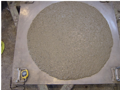
高流動コンクリートのフレッシュ性状（スランプフロー）

高流動コンクリートの用途としては、振動締固めが困難な箇所や、コンクリートの急速・大量打設、工場製品で振動締固め時の騒音、振動を防止したい場合、また打ち込み作業の省力化やコンクリートの品質向上を図りたい場合などに使用されます。