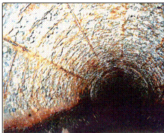
下水道施設の硫酸劣化

下水道施設の硫酸劣化は、下水中の硫酸イオンが嫌気性細菌によって硫化水素となり、上記作用によって硫酸が生成されたことによる侵食です。