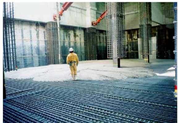
高流動コンクリートによる マットスラブの無人化施工

一方海外では、1995年頃から研究開発や実構造物への適用が行われるようになり、デンマークやオランダ、中国などでの適用が報告されています。